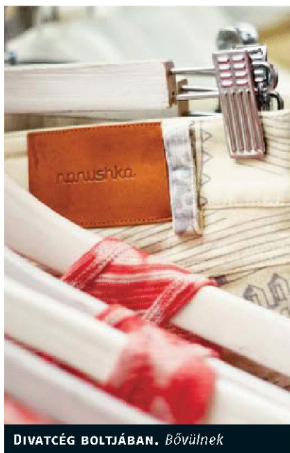
DIVATCÉG BOLTJÁBAN. Bővülnek

a mozifilmek forgalmazásával foglalkozó InterCom Nemzetközi Kulturális Szolgáltató Zrt., melynek százszázalékos tulajdonosa a Holland Antillákon bejegyzett, egyébként Andrew G. Vajna filmügyi biztos és többszörös kaszinótulajdonos érdekeltségébe tartozó Magyar Enterprises C.V. Van a befektetések között ásványvíz-forgalmazó, borászati, szoftverfejlesztő vállalkozás, de magánrepüléssel foglalkozó légitársaság is. Utóbbi cégbe 220 millióval szállt be az Euroventures tavaly decemberben, így még korai lenne megítélni, jó helyre