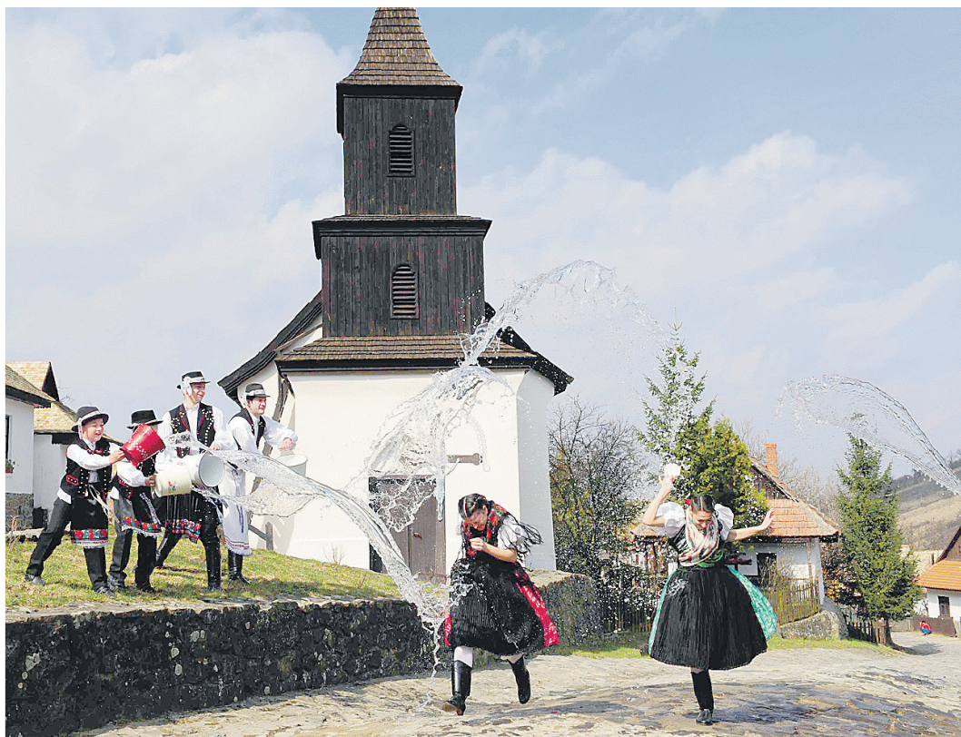
A négynapossá lett ünnep miatt megugrottak az előzetes szállásfoglalások